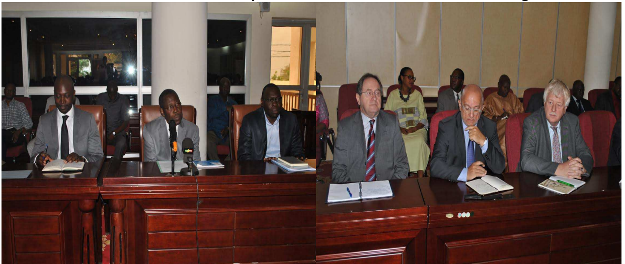
Photo 1 : séance d'information des diplomates au ministère des affaires étrangères