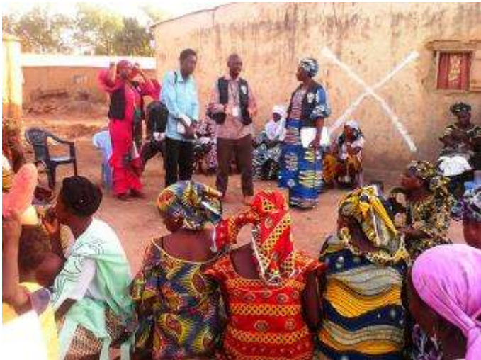
Dialogue communautaire à Kourémalé