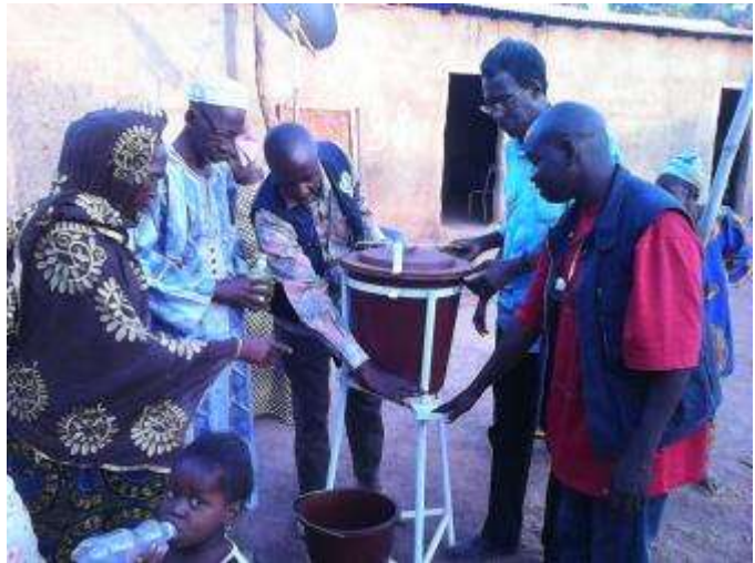
Une initiation au lavage des mains au savon à Kourémalé