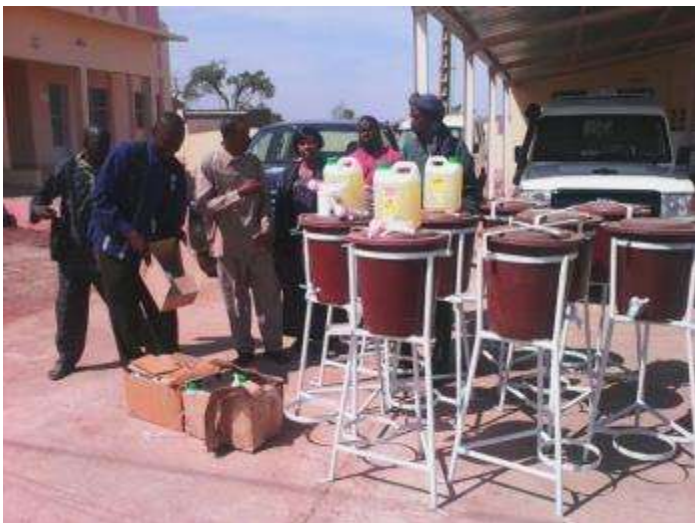
Remise par l'OMS des équipements, produits et matériels la prévention au District Sanitaire de Kangaba