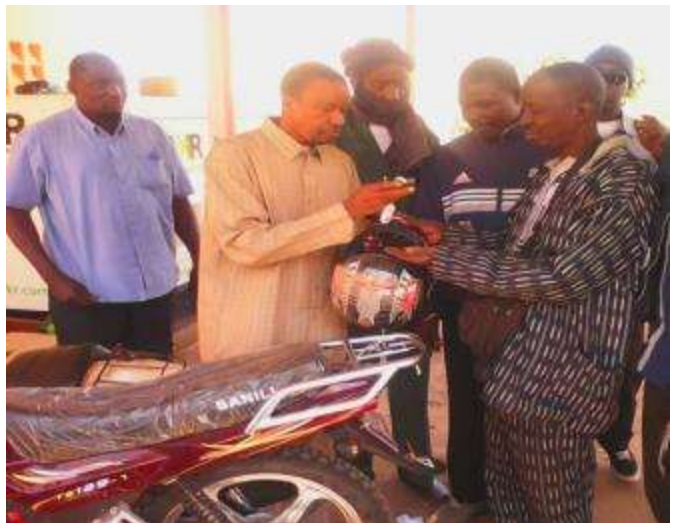
Remise par le COU de deux motos au CSCOM de Kourémalé pour appuyer les cordons sanitaires