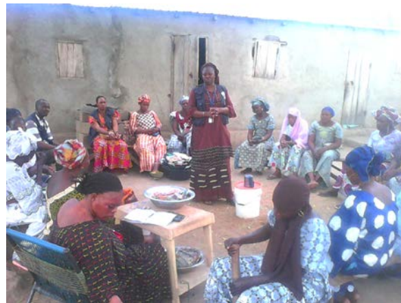
Séance d'information et de sensibilisation auprès du groupement de femmes « Benkadi » de Kangaba sur la MVE par l'équipe OMS/Kangaba-Kourémalé et le SLDSES de Kangaba contre la MVE avec son partenaire « Arche Nova »

La carte ci-dessous renseigne sur la localisation des cas confirmés et probables.