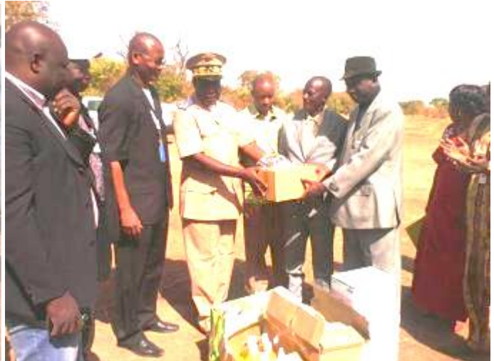
Le Préfet du cercle de Kangaba remettant le matériel au Président du conseil de cercle de Kangaba.